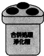
がっぺいじょうかそう 合併浄化槽とは…