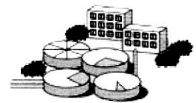
げすいしよりじょう 下水処理場とは…

お家ごと、または何軒かのお家の集まりで、トイレの水と生活排水を一緒にある基準まで綺麗にする設備。