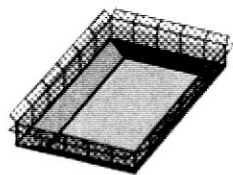
ちょうせい池 調整池とは…